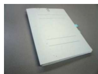
紙ファイル・ フラットファイル