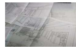
トレーシングペーパー