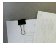
クリップ・ホチキス