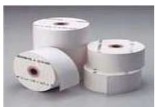
レシート・レジロール

弊社は、固い物を砕く刃と水流で紙を攪拌し、繊維を分離させて溶解しています。 水に溶けず、機械トラブルに繋がる恐れのある物 を禁忌品対象としています。 ご不明な点がございましたら 資源開発部までお問い合わせください 。